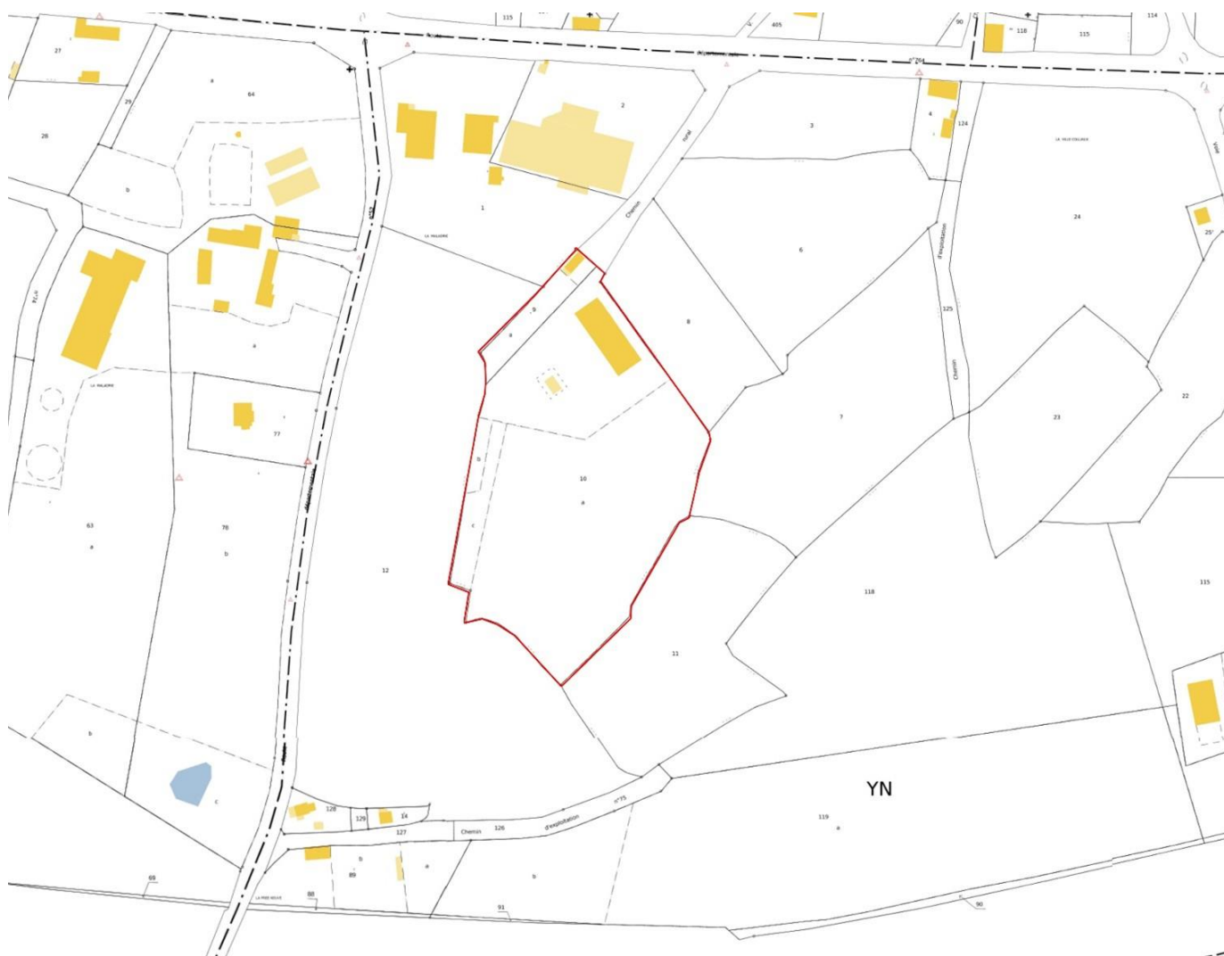
Figure 4. Plan cadastral, aux abords du site